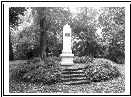
A Kossuth téri 1848–49-es emlékmű rekonstrukciója. Itt tartották a helyi forradalmi események kezdetét jelentő nagygyűlést.