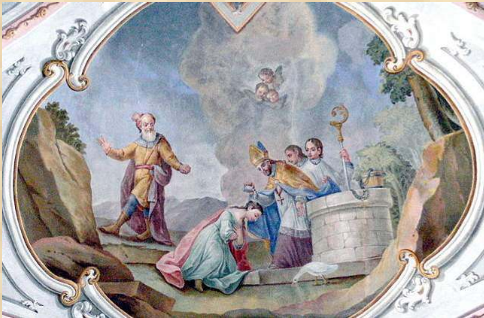
Szent Márton megkereszteli édesanyját