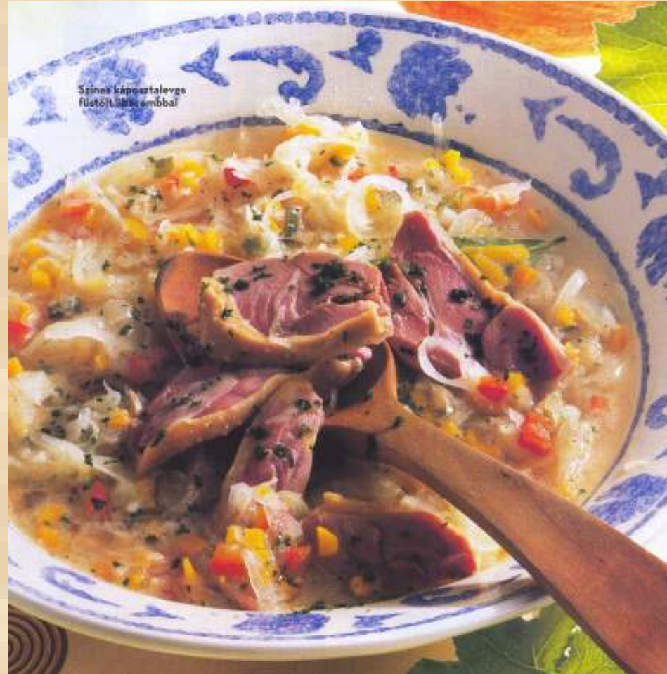
Színes káposztaleves füstölt libacombbal